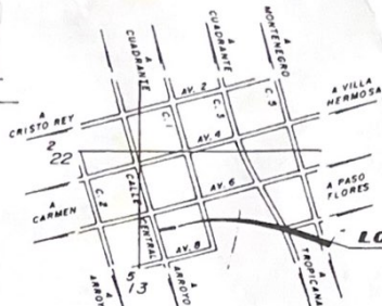
UBICACION NOJA LA LAJUELA ESCALA 1 : 10.000

COLEGIO FEDERADO DE INGENIEROS Y DE ARQUITECTOS DE COSTA RICA 07 AGO 2007 ANOTADO