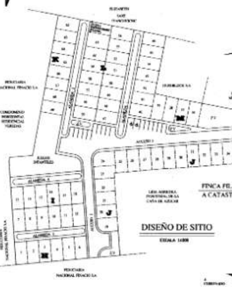
DISEÑO DE SITIO ESCALA 1:800