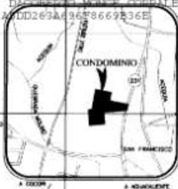
UBICACION GEOGRAFICA HOJA: TEJAR. ESCALA 1:50.000

INSCRIPCIÓN: 3-1049374-2006 Fecha: 30/01/2006 13:53:34 Registrador: DORIS MARCELO TORRES 871C1341A DD289A 9658669236E